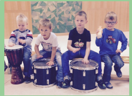
Musik belebt die Sinne