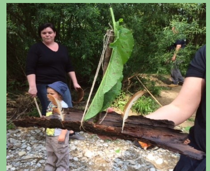
Spiel- / Bastelstationen